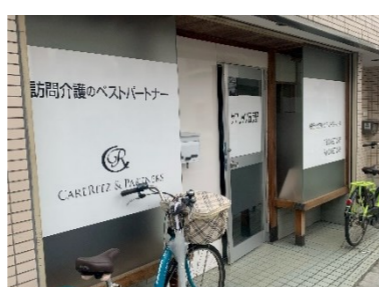
ケアリッツ五反野様