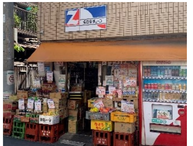
フードショップ豊岡様