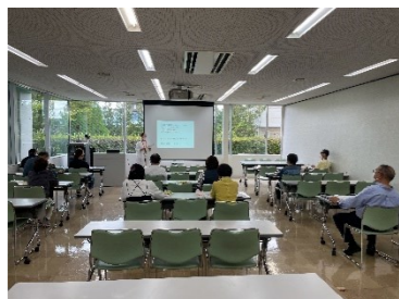
② 認知症サポーター養成講座の様子

① 認知症声かけ訓練は、男性 6 名、女性 16 名、計 22 名の参加がありました。快晴の中、3 チームに分かれ声かけを行いました。時間が経過するごとに、積極的に包括職員に対して質問をしたり自ら声かけをする姿が見られました。笑顔の絶えない和やかな時間でした。