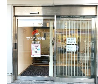
サンワ薬局足立店様