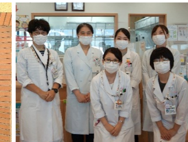
はなまる薬局五反野店様