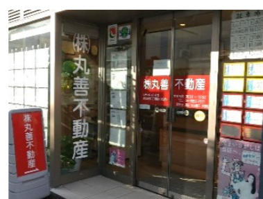
株式会社 丸善不動産様