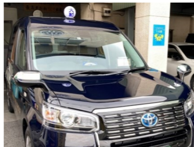
栄光交通株式会社様