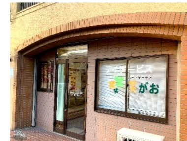
パートナーケア 笑がお様