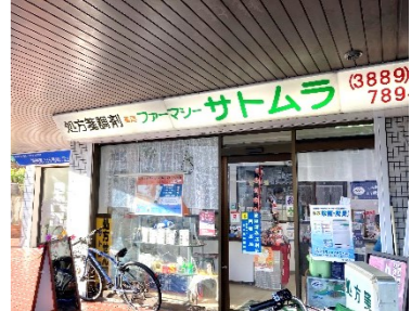
薬局ファーマシー サトムラ様