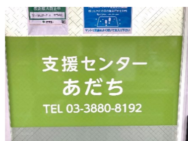
支援センターあだち様