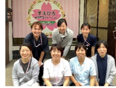
すえひろ訪問看護ステーション様