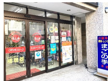
佐々木ケアサービス 株式会社様