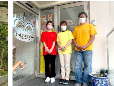
放課後等デイサービス まつぼっくりツリー様