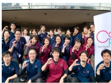
ケアプロ訪問看護ステーション東京 足立慶友サテライト様