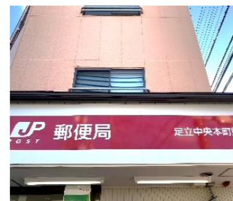
足立中央本町郵便局様