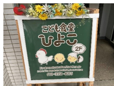
子ども食堂ひよこ様