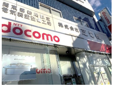
docomo ショップ 足立店様