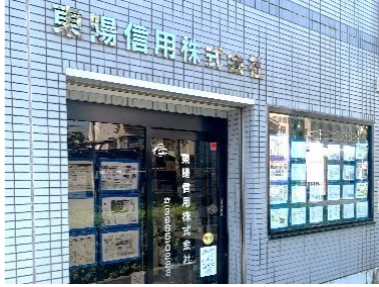
東陽信用株式会社様