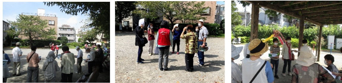
① 認知症声かけ訓練の様子

① 認知症声かけ訓練は、男性 6 名、女性 16 名、計 22 名の参加がありました。快晴の中、3 チームに分かれ声かけを行いました。時間が経過するごとに、積極的に包括職員に対して質問をしたり自ら声かけをする姿が見られました。笑顔の絶えない和やかな時間でした。