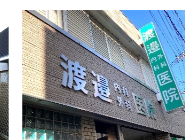
渡邊内科外科医院様

絆のあんしん協力機関募集中です！ 絆のあんしん協力機関とは、地域の高齢者に気を配り、日常の業務や活動の中で相談を受けたり、声かけなどをして頂いている団体のことです。異変に気付いた時には地域包括支援センターと連携をとっています。