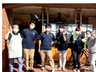
社会福祉法人 つくしの郷 生活学館 足立校様