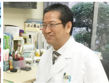
あべ内科小児科様