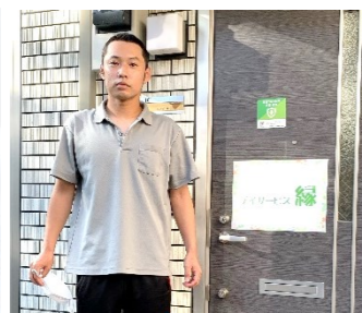
株式会社 G・F デイサービス様