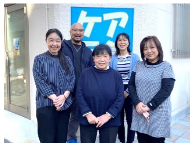
株式会社 AMAO ケア元気様